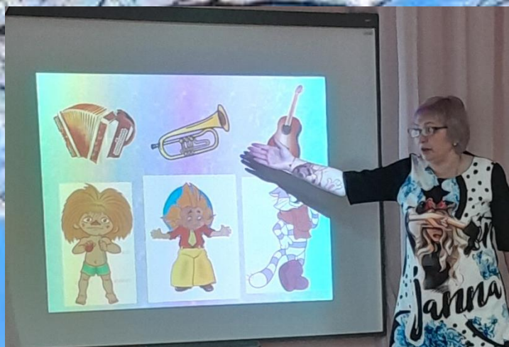
Остановка «Музыкальная школа»