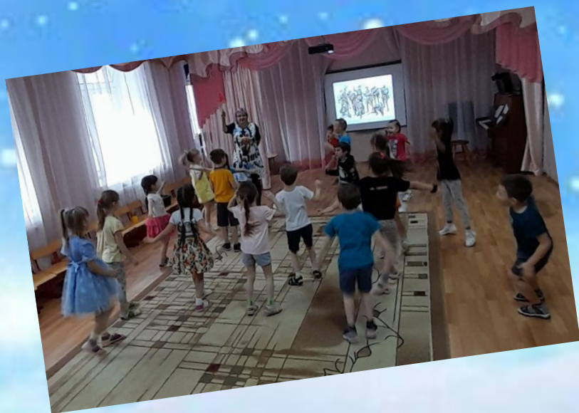
Остановка «Музей Победы»

Дети помогают Буратино найти музыкальные инструменты