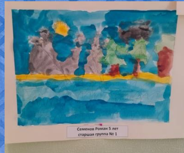
Семенов Роман 5 лет старшая группа № 1